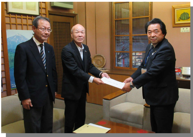
▲左から 梅津副会長 大竹会長 内谷市長