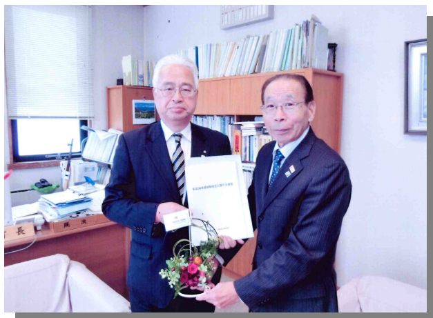
▲左から 後藤町長 高橋副会長