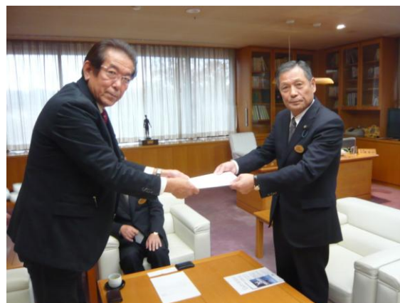
▲左から 鈴木副会長 安部副議長