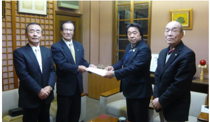
▲左より 北原理事 平会長 内谷市長 大竹理事