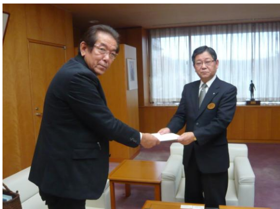
▲左から 鈴木副会長 仁科町長