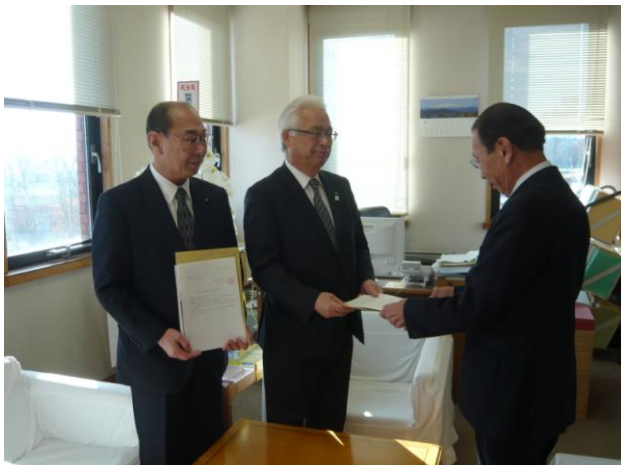
▲左から 後藤議長 後藤町長 高橋副会長