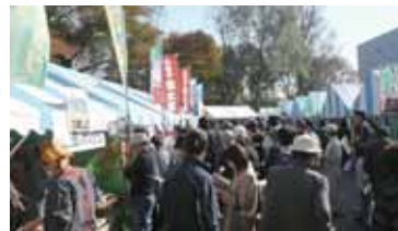
▲ 11/7 小国鍋祭りでのPR