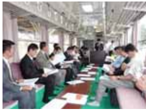
山形県青年部会連絡協議会 長井で開催！

県内の単位会が持ち回りで開催する協議会が6月長井市で開催されました。長井の特色を活かし、フラワー長井線の列車内での会議、長井ダムを見学、その後、100周年を迎えたあやめ公園内の「たつみ家」で昭和レトロたっぶりの懇親会を行い、県内の青年部会の皆さんと親睦交流を深めました。