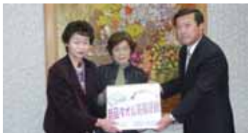
▲いいで福祉会ひめさゆり荘へ