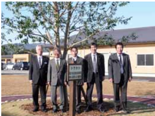
▲ 11/30 飯豊町福祉作業所でんでんに 植樹を行いました。