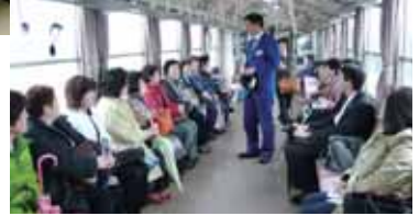
▲長井線に揺られ！笑顔で出発