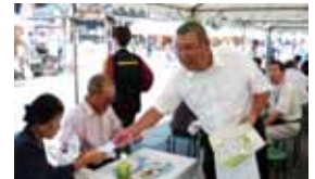
▲▼白鷹町鮎まつりでPR